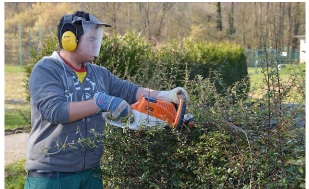
Freie Ausbildungsplätze haben wir auch noch bei den Gartenfachwerkern Fachrichtung Garten- und Landschaftsbau.

An beiden Standorten haben wir in den Berufsvorbereitenden Bildungsmaßnahmen noch freie Plätze.