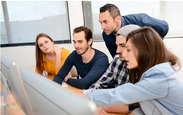
Fachinformatiker/ Fachrichtung Anwendungsentwicklung

In Mosbach bieten wir neue Berufe an - auch hier haben wir noch freie Plätze: