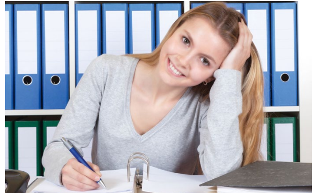
Fachpraktiker/-innen für Bürokommunikation