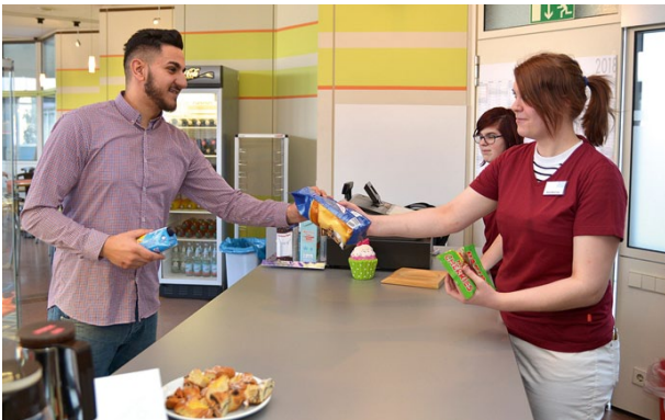
Fachverkäufer/in im Nahrungsmittelhandwerk